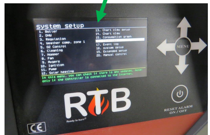
Menu option 16

Please note: When you download directly to the controller, all pictures might not be updated. If you want these pictures, we recommend to update with a SD-card. Please enter page for download via SD-card on www.nbe-global.com . Under "Download" you can choose the version you want.